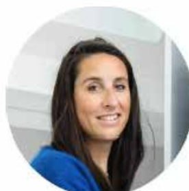
Sarah Danze Graphisme