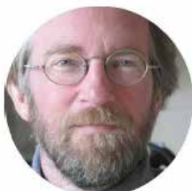
Gerard Klap Traduction